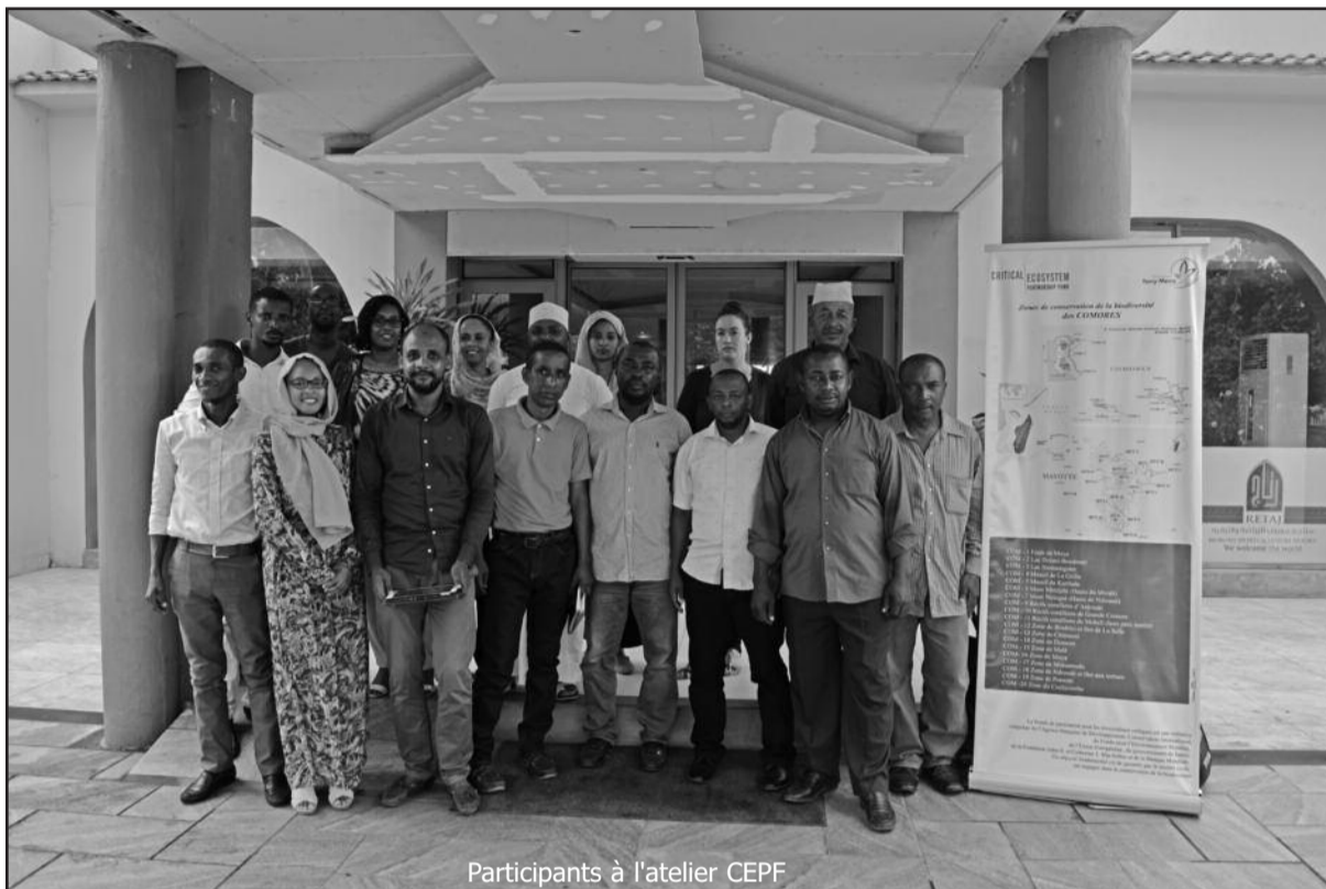
Participants à l'atelier CEPF

Dans un premier temps, un appel à lettres d'intention pour les grandes subventions a été lancé au niveau du Hotspot de l'Océan Indien en septembre 2018, appelant les organisations de la Société civile à conjuguer leurs efforts pour entreprendre des initiatives en faveur de la préservation de la biodiversité dudit hotspot. C'est le Fonds de Partenariat pour les écosystèmes critiques ou « Critical Ecosystem Partnership Fund » (CEPF), qui est une initiative conjointe de l'Agence Française de Développement (AFD), la Banque Mondiale, la Conservation Internationale, l'Union Européenne, le gouvernement du Japon, la Fondation MacArthur et la Fondation